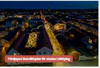
Förtydligad översiktsplan för staden Lidköping