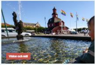
Viken och mår