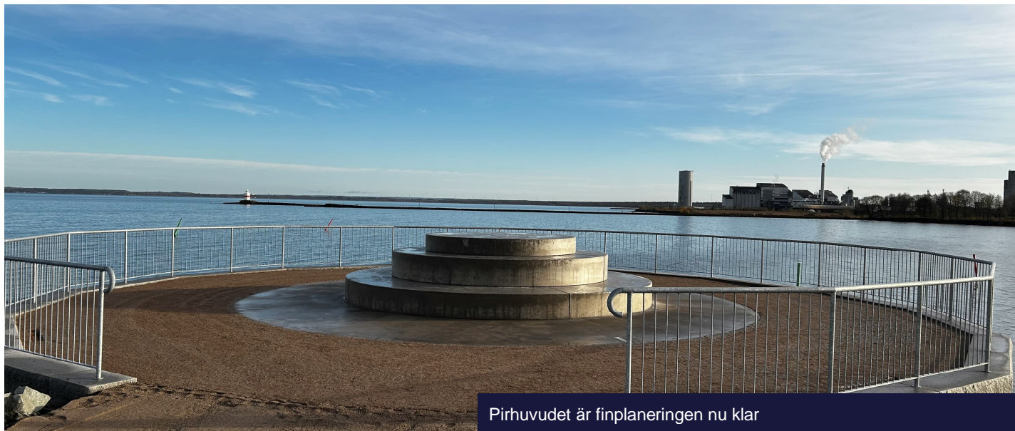
Pirhuvudet är finplaneringen nu klar

Månadsbrev ♦ Oktober 2024 ♦ Avdelning NCC Civil south east