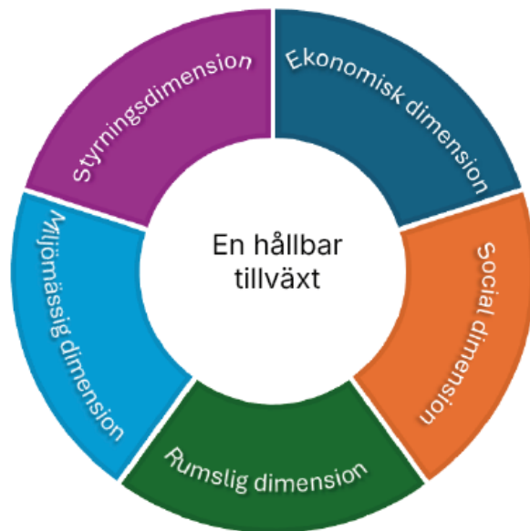
Figur 1 – Fem dimensioner i en hållbar tillväxt

I figuren nedan (Figur 1) illustreras att det krävs ett balanserat och integrerat angreppssätt där ett flertal dimensioner vävs samman till en helhet för att skapa attraktiva städer och samhällen.