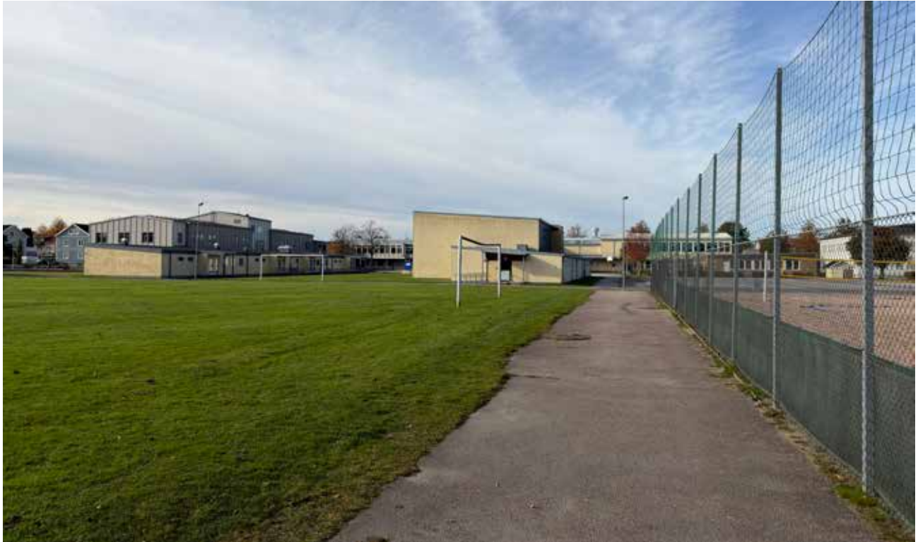
Ovan: Skolmiljön sedd från insidan av staketet vid Silversköldsgatan. Från detta håll är gymnastiksalen en sluten volym utan fönsteröppningar.