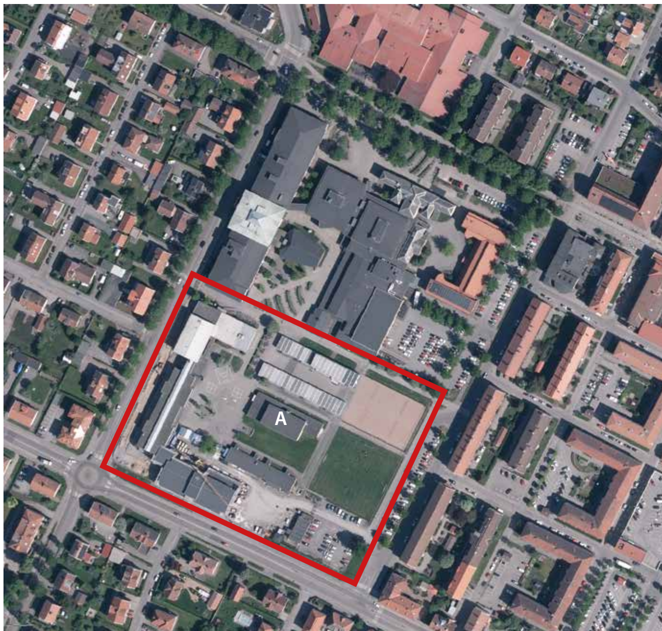
Ortofoto över det aktuella kvarteret. Gymnastisalen är centralt belägen och är markerad med ett A.