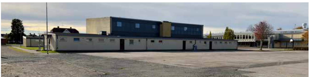
Fyra bilder som visar området från olika håll. Överst syns skolområdet från utsidan av stängslet i öster följt av en liknande vy från insidan av området. De två understa bilderna visar skolgårdsområdet sett från norr.