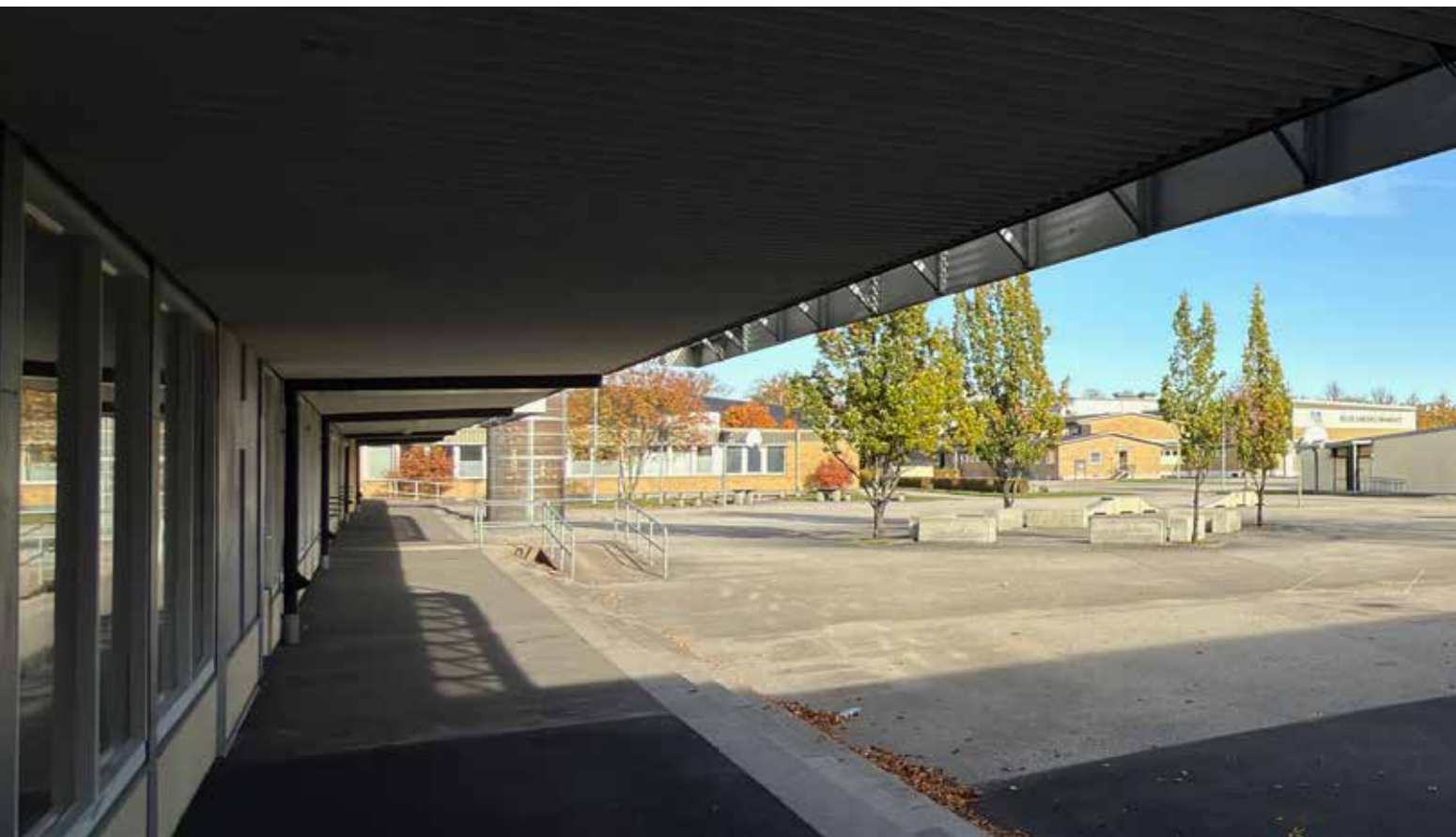
Nedan: Vy över skolgården med den centralt placerade gymnastikbyggnaden i mitten. Byggnaden trappar upp silhuetten av volymerna på gården och bildar en sammanhållande fond gentemot den öppna ytan bakom.