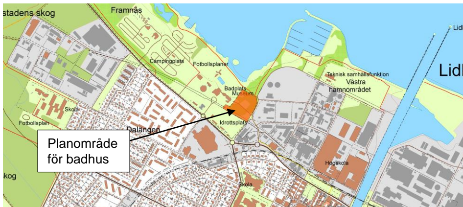
Figur 2 Lokalisering av planområde för badhus.

I figuren nedan illustreras området för det planerade badhuset. Om det kommer att vara utomhusbassäng vid det planerade badhuset kommer den att ligga i sydvästra delen av planområdet, dvs så långt som möjligt från industriområdet.