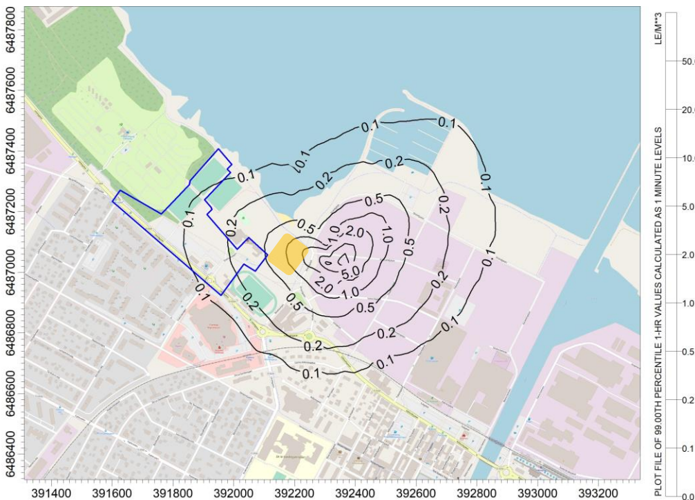
Figur 6 Resultat spridning av lukt från Sabels verksamhet. Halter 1,5 m över mark.

Den verksamhet som ligger närmast planområdet är Sabel och i figuren nedan redovisas en spridningskarta som visar det enskilda luktbidraget från verksamheten. Ungefärligt planområde markeras i orange.