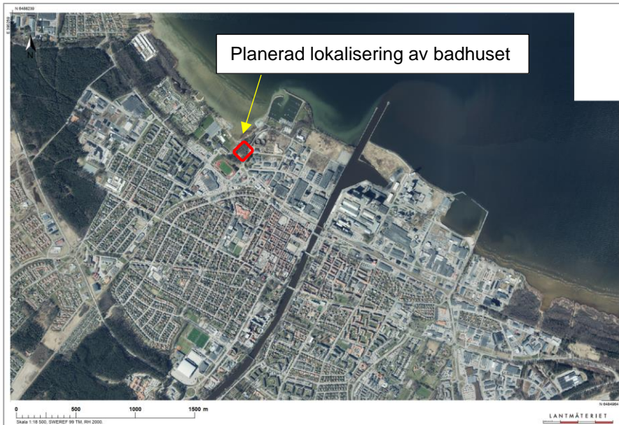
Figur 1 Lokalisering av område för planerat badhus

Väster om badhuset ligger Framnäs som idag är ett rekreationsområde med bland annat ett utomhusbad, ett museum och en idrottsplats. I Framnäs pågår ett planarbete för ca 600 nya bostäder.