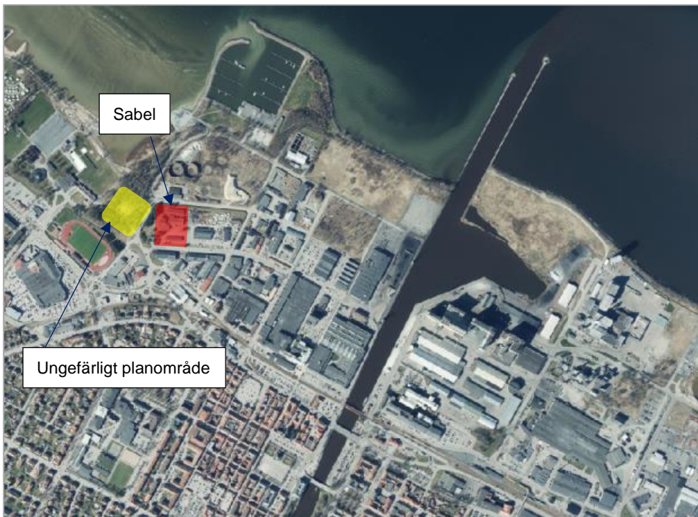
Figur 4 Sabels ungefärliga verksamhetsområde markerat i rött. Ungefärligt planområde markerat i gult.

Verksamheten är belägen ca 50 meter öster om planområde för det planerade badhuset och är den verksamhet som främst riskerar att påverka luftmiljön inom planområdet.