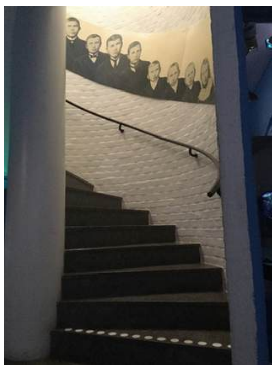
Går du upp för trappan...