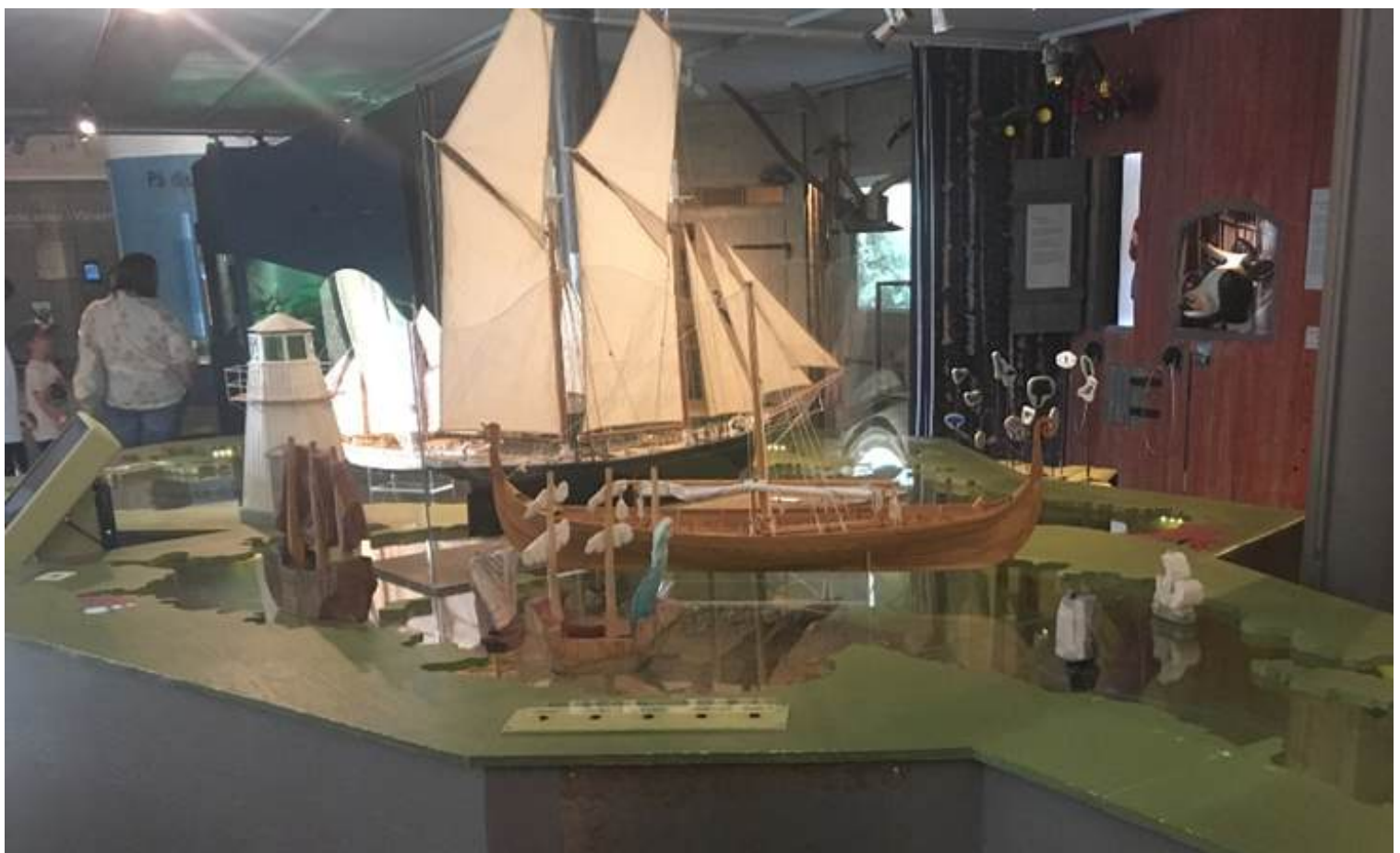
Modell av Vänern med skepp och vrak