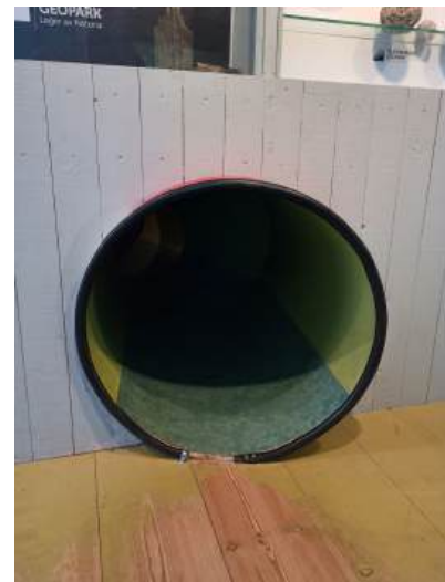
Tunnel till sjöfruns gömma