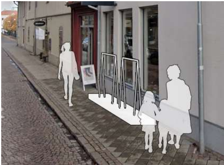
Illustration av varuskyltningens utformning och placering. Här är skyltningen placerad på en upphöjd och väl avskild platta

Illustration av varuskyltningens utformning och placering. Här är skyltningen avskärmd med en minst 10 cm hög avskiljning i markplanet. Gående kan fortfarande passera och skyltningen skymmer inte brandposter, brunnar, avstängningsventiler, P-automater, nedstigningsschakt, kopplingskåp, offentlig belysning, trafikmärken, trafiksignaler eller dylikt.