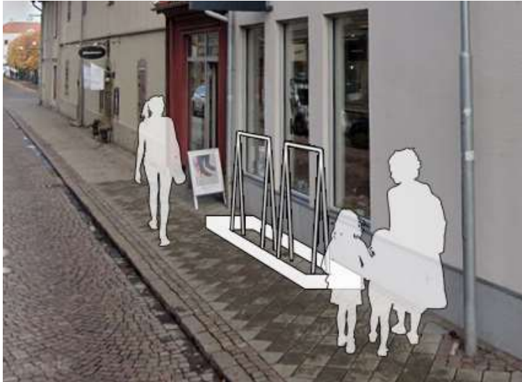
Illustration av varuskyltningens utformning och placering. Här är skyltningen avskärmd med en minst 10 cm hög avskiljning i markplanet. Gående kan fortfarande passera och skyltningen skymmer inte brandposter, brunnar, avstängningsventiler, P-automater, nedstigningsschakt, kopplingskåp, offentlig belysning, trafikmärken, trafiksignaler eller dylikt.