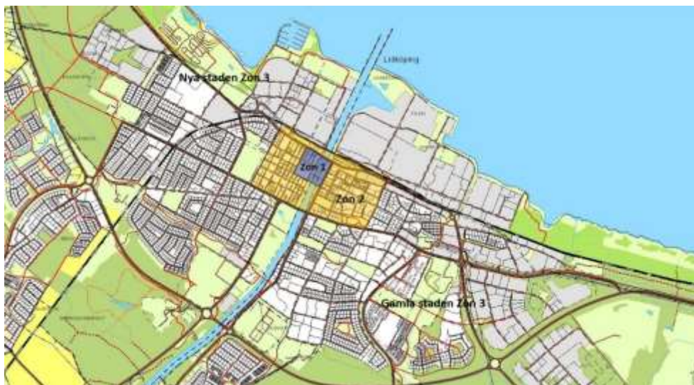
Illustration på zonindelning, för taxa vid evenemang: Zon 1 Området runt torget, Zon 2 Centrum Lidköping, Zon 3 Övriga.

Beroende på var evenemanget äger rum kan påverkan på området variera och därmed priserna för upplåtelse. Lidköpings stad har delats in i tre zoner, se karta.